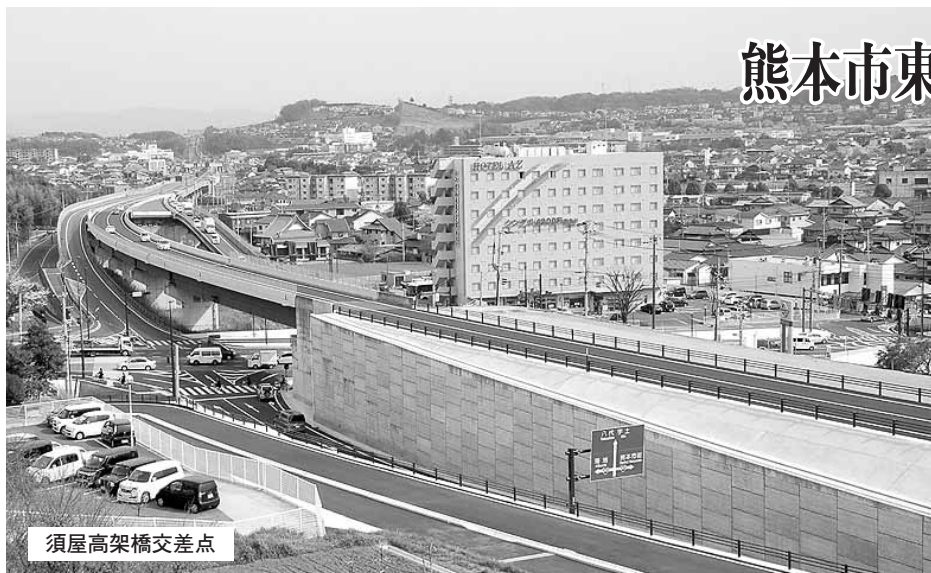
須屋高架橋交差点

国道3号熊本北バイパス(熊本市北区四方寄~合志市須屋間1.8km)が3月28日に暫定2車線で部分開通し、事業化から41年越しに整備延長7.6kmが全線開通した。地域の主要幹線道路としてだけでなく、東バイパスと連結して熊本市東部圏の環状道路を形成する主要道路としても位置付けられており、全線開通によって交通状況の改善や、経済への波及効果など多くの好影響を生み出すことが期待されている。