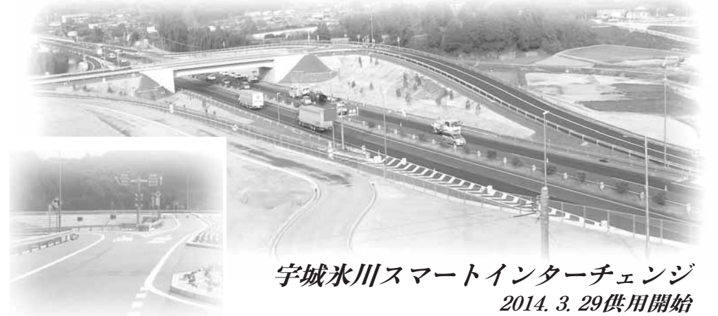
宇城氷川スマートインターチェンジ 2014. 3. 29供用開始

〒869-4815 八代郡氷川町鹿島 1618-2 TEL 0965-52-0743 FAX 0965-52-3279