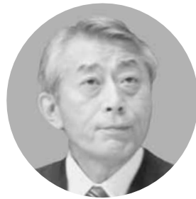
西日本高速道路株式会社

九州横断自動車道延岡線は、熊本県上益城郡嘉島町と宮崎県延岡市を結ぶ約95kmの国土