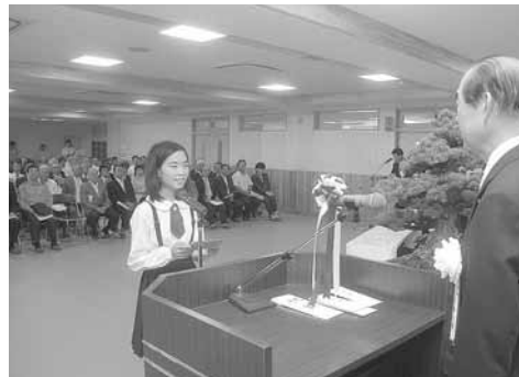
夢のような学校 落成式に180人出席

最後に、菊陽中部小学校新校舎建設に携わった皆様、落成に当たってのごあいさつとさせていただきます。